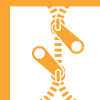
FERMETURE ÉCLAIR À 2 VOIES